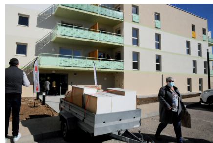
Résidence Cœur de Ville de CDC Habitat

Après la réalisation des aménagements de la Place centrale Roger-Rémond, la création d'un restaurant-brasserie et le déménagement de la Poste dans de nouveaux locaux, les projets se poursuivent pour faire vivre cet espace de vie central avec les programmes de constructions de nouveaux logements et l'équipement culturel.